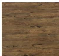
001 - KBW 8611 - Megara