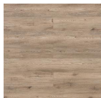
004 - KW 6053 - Bow