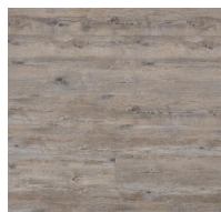
003 - KW 6022 - Olimpo