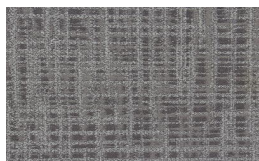
002 - Medio