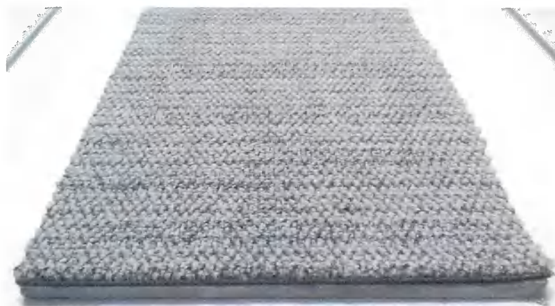
Figura 2: Material ensaiado

O material foi colado a placas padrão de fibrocimento com auxílio de adesivo não identificado.