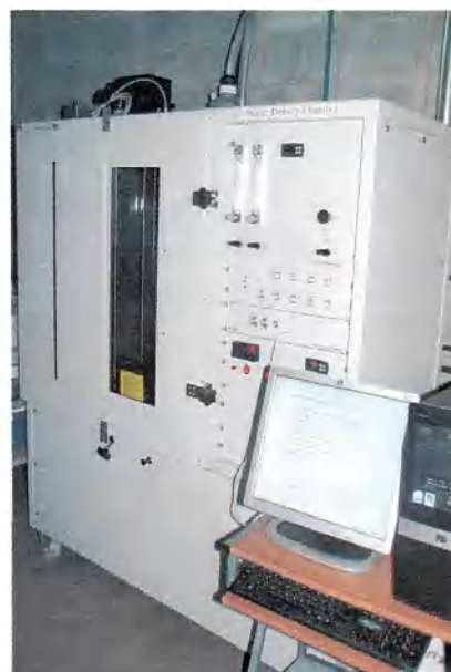
Figura 1: Câmara de ensaio

Os resultados do ensaio estão apresentados na forma tabular neste relatório. De acordo com a norma, os ensaios são conduzidos até um valor mínimo de transmitância ser atingido, agregando-se, no mínimo, um tempo adicional de ensaio de três minutos, ou até o tempo máximo de ensaio de 20 minutos, o que ocorrer primeiro.