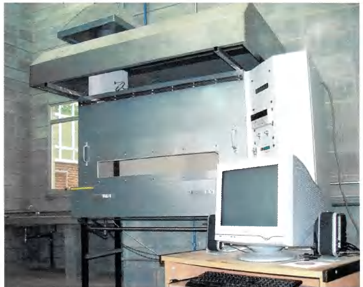
Figura 1: Equipamento de ensaio

Os corpos de prova, com dimensões de 230 \pm 5 mm de largura e 1.050 \pm 5 mm de comprimento, são colocados em posição horizontal e abaixo de um painel radiante poroso inclinado a 30^\circ em relação a sua superfície, sendo expostos a um fluxo radiante padronizado. Uma chama piloto é aplicada na extremidade do corpo de prova mais próxima do painel radiante e a propagação de chama desenvolvida na superfície do material é verificada, medindo-se o tempo para atingir as distâncias padronizadas, indicadas no suporte metálico onde o corpo de prova é inserido.