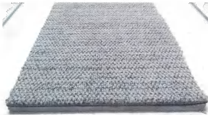
Figura 2: Material ensaiado

O material foi colado a placas padrão de fibrocimento com auxílio de adesivo não identificado.