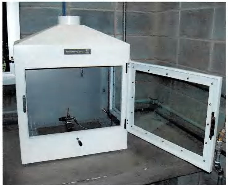
Figura 1: Câmara de ensaio.

Os corpos de prova, com dimensões de 250 mm x 90 mm, para produtos normais, ou 250 mm x 180 mm, para produtos que contraem ou derretem para longe da chama do queimador sem serem ignizados, são presos no suporte dentro da câmara de ensaio e colocados em contato com a chama do queimador, com um filtro (lenço) de papel posicionado abaixo do corpo de prova. É verificada, então, a propagação da chama, levando-se em conta o tempo em que a frente da chama leva para atingir a marca de 150 mm, medida a partir da extremidade inferior do corpo de prova. São realizados dois tipos de aplicação de chama: de superfície e de borda.